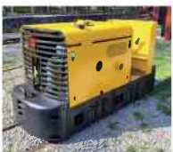
Stockholm - Diesellok