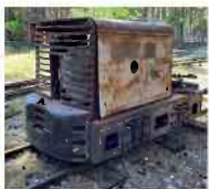
Sandviken - Diesellok