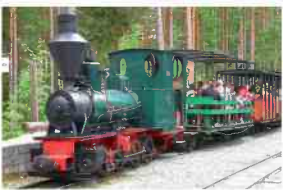
Mormor - Ånglok från 1910