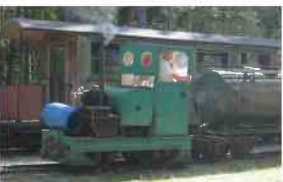
Simplex - Diesellok