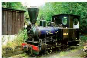
Karolina - Ånglok från 1919