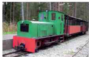
Dragos - Diesellok