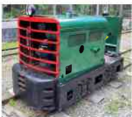
Otterbäcken - Diesellok